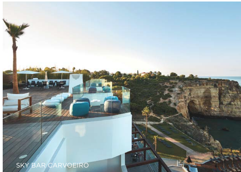
SKY BAR CARVOEIRO